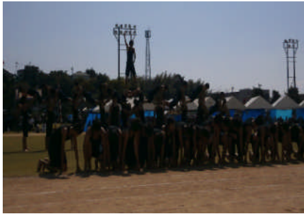
体育祭 枕崎市市民運動会